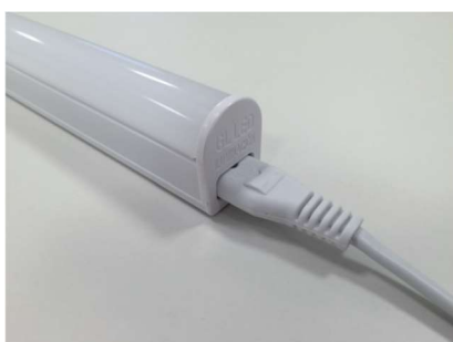
Para una única regleta, conectar el cable de red.