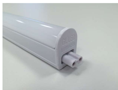
Para conectar varias regletas, insertar el accesorio.